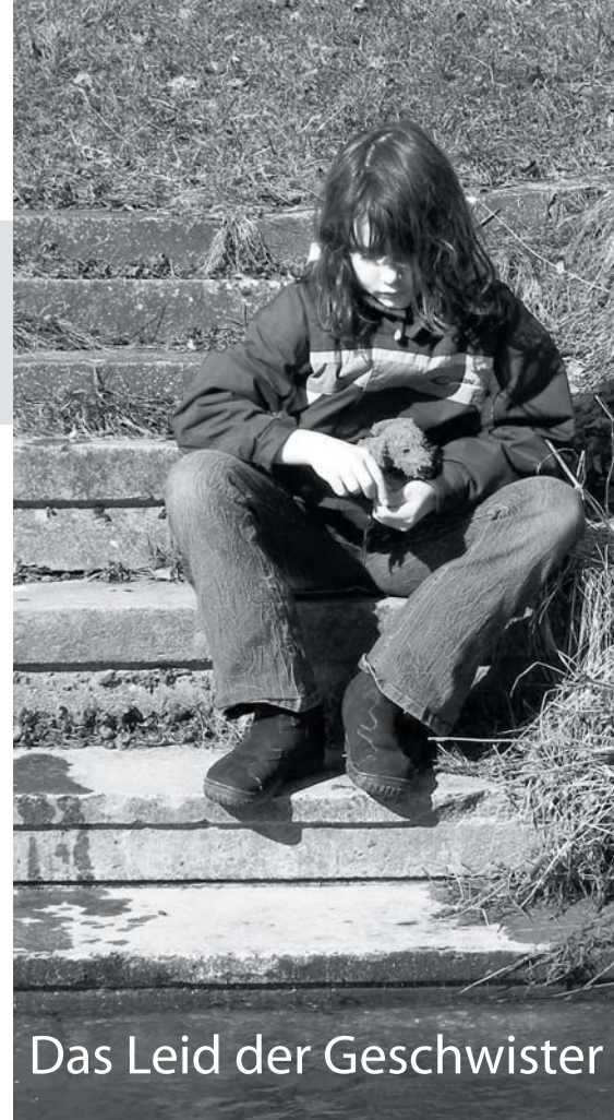
Das Leid der Geschwister

Manche Eltern belasten ihre lebenden Kinder sogar direkt, indem sie ihnen sagen, dass sie die Abtreibung „zu ihrem Wohl“ gewählt hätten oder indem sie etwa mit ihnen darüber diskutieren, ob sie das Geschwisterchen abtreiben sollen oder nicht. Indem Eltern beispielsweise fragen „Willst du dein Kinderzimmer und deine Spielsachen teilen?“, wälzen sie die Last ihrer eigenen Verantwortung auf ein kleines Kind ab und machen es zum Komplizen bei der Tötung des Geschwisterchens.